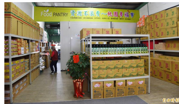
桃園市慈馨實物銀行